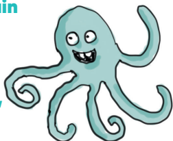
Illustration : Jacques Azam.

Poulpo sera le meilleur copain des enfants ! Il leur donnera rendez-vous lors de deux webinaires, le 20 janvier et 6 avril 2023, pour les accompagner dans leur découverte de l'océan.